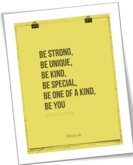
Jugendlichen mit Trisomie 21.